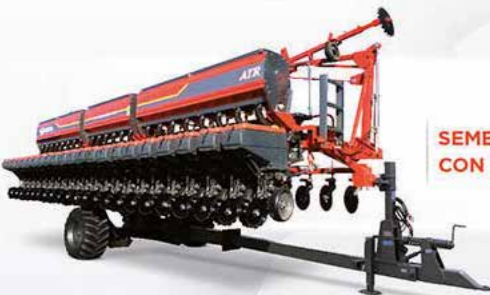
SEMBRADORA ATR TI CON DOBLE FERTILIZACIÓN