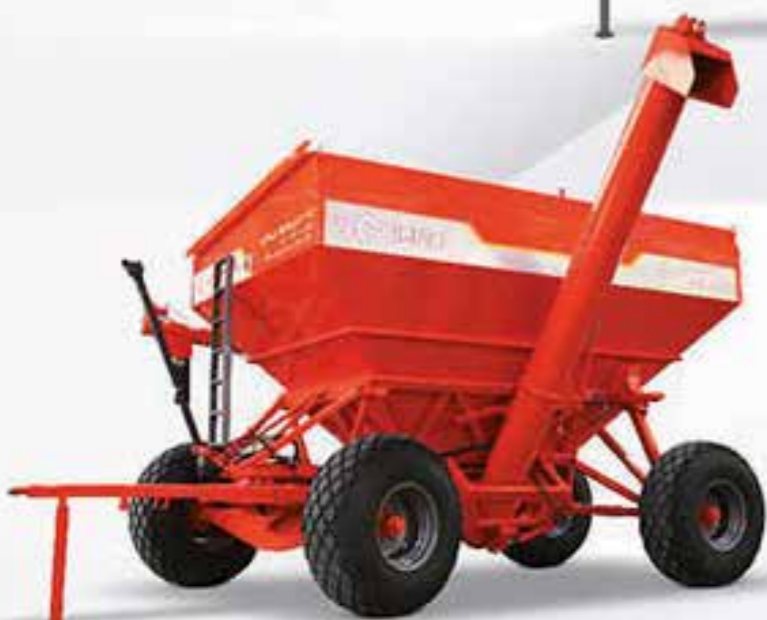
TOLVA AUTODESCARGABLE "MP 22"