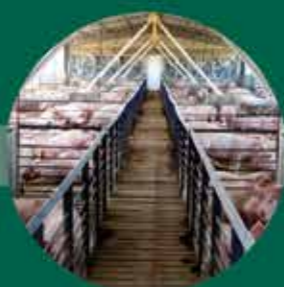
CRIADERO DE CERDOS